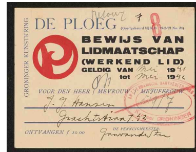
H.N. Werkman, bewijs van lidmaatschap De Ploeg (ca. 1938).