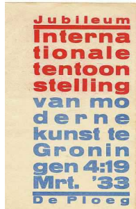
H.N. Werkman, voorplaat catalogus (1933). GRONINGER MUSEUM