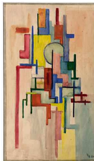
Wobbe Alkema, Compositie (1924). GRONINGER MUSEUM

geest' bij deze jonge Groninger schilders, waarbij vooral het modernistische werk van Wiegiers en Jan Jordens opvalt. Minpuntje voor de Ploeg-leden zelf is de tegenvallende verkoop. Ook een tentoonstelling in Amsterdam wordt (gematigd) positief ontvangen.